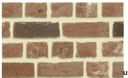
VIEUX-GOTHIQUE BRIQUE DE BAEKEL