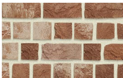
BELLE EPOQUE DE MARCHE BAEKEL