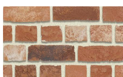
VIEUX-LIMBOURG BRIQUE DE BAEKEL