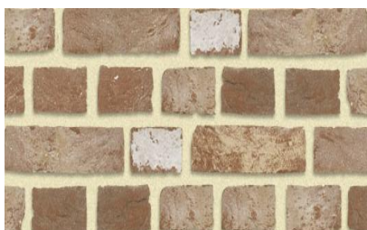
VIEUX-HESBAYE BRIQUE DE BAEKEL